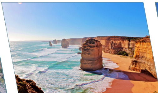
Australia, i Dodici Apostoli al tramonto