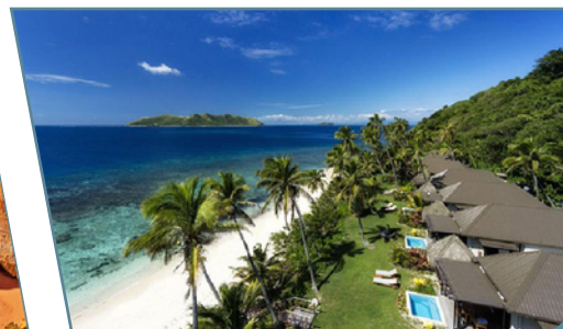
Fiji, Matamanoa Island Resort

Partenze giornaliere da Milano, Venezia, Bologna e Roma con voli Emirates/Qantas/Fiji Airways da Bergamo, Napoli e Catania con voli flydubai in classe economica